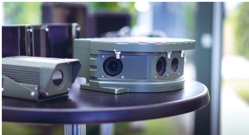
Copenhagen Sensor Technology producerer komplekse overvågningskameraer.

Copenhagen Sensor Technology's lange liste af slutkunder tæller blandt andet en række forsvarsmyndigheder. Ofte kræ-